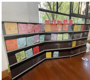
插片式链接式观察墙

链接式观察墙在使用过程中需考虑幼儿和教师操作简便，KT 板上可通过插片式、雌雄扣黏贴式、游戏故事册、夹板式等等不同的操作，这样既能让幼儿自主操作记录，方便展示游戏故事、游戏问题。作为一个幼儿自主分享、师生共享的移动墙面，除了集体分享解决共性问题外，餐后、自由活动等时间幼儿还可以和同伴互享，教师可以与幼儿一对一分享、记录，让游戏故事被“看见”、“听见”。