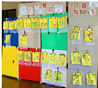
板夹式链接式观察墙